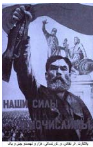
پلکارته اثر تفلیس، و. کورساکو، هزار و نهمصد چهار و هفتاد