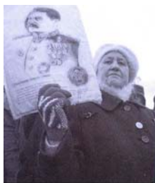
را هلیبر امرادسی