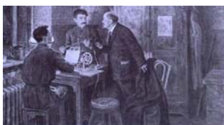
لنین و استالین در تماس مستقیم