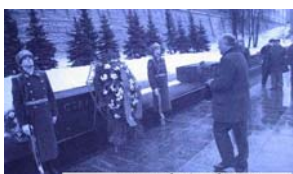
نثار شایخ گلن پر از اسگناه استمالین