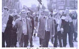
چنان بهار و همبستگی بین المللی