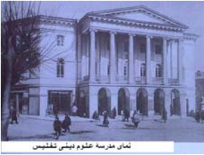
نمای مراسمات حضور دینسی نقشبش