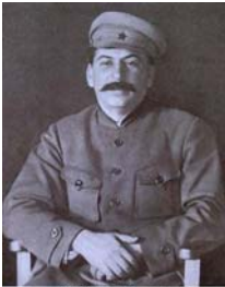
استالین از ساسهای جنگ دانکش