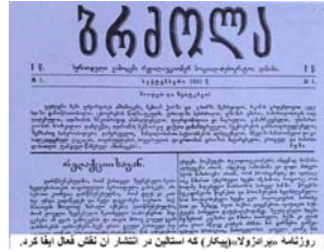
روزنامه دیر انزولا (پوتیلوف) که استالین در انتشار آن نقش عمل ایفا کرد.