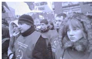
نکار نماز جوان حزب کمونیست جمهوری و فدراتیو روسیه