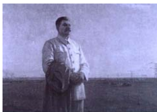
صبح میهن ما، اثر نقاشی ف. شورپین