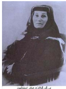
بی. گد. گانازو، مسخر استالین