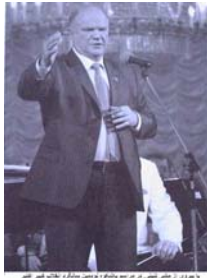
في 2015، في حفل جوائز، من رسم جوائز لـ "التميز في العمل" من قبل "مركز