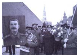
بکار ز بحر کبیرمان را آفراس می داریم