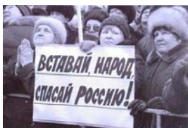
مردم، بپا خیز، روسیه را نجات بده!