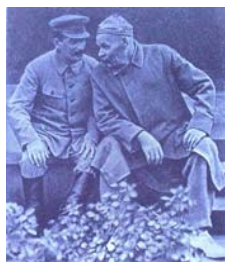
ساکسیم کورکی و استالین