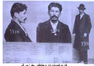
کارت فیدرات ادار د خاقانم بطرز یورگ