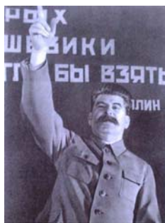
هوج فیه اثر که بنسوخا نون ننه فوج کسند، وجود سارده