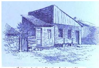
خانه ای در شهر گور و نه استالین در آن چندم به جهان کشود.