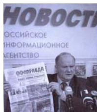
وچوه چینن خایبر و آلیعت دارد