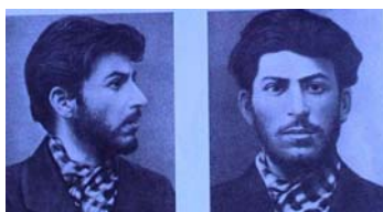
استالین در سال هزار و نهمصد از ارسینو انداره ژاندارمری تفلیس